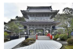
大本山総持寺祖院・山門

本山は1910(明治43)年、再建で山門、仏殿などがよみがえり、消失を免れた建物とともに、根本道場の威厳を伝え、今も風格ある山門や仏殿、法堂などが残っています。