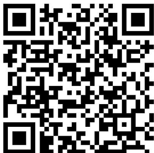
全空連マイページQRコード

(選手)全空連マイページ登録 ⇒ (選手)情報最終確認書提出(FAX可)5/23 必着 ⇒ (兵空連)出場申込5/24 ⇒ (選手)下記のQRコードより大会エントリー承諾5/30 必着 ⇒ ⇒ (兵空連)選手全員の承諾確認 ⇒ (兵空連)全選手の最終承諾 ⇒ 完了