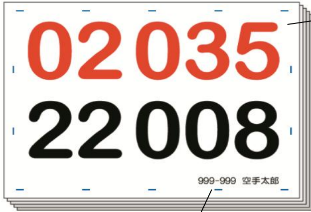
会員番号・選手名入り

兵庫県空手道連盟主催競技大会にて、大会用ゼッケンの斡旋販売を致します。 ゼッケン番号・会員番号・選手名・指定の縫い目の場所を印刷してお届けします。 なお、この斡旋販売は、任意です。別途ゼッケン制作方法に従い各自でお作り頂くことを基本としています。 形・組手の2競技用