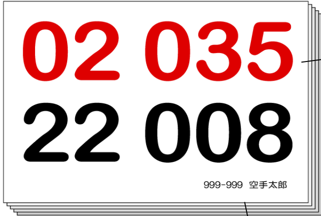
形・組手の2競技用

本年度も、兵庫県空手道連盟主催競技大会にて、大会用ゼッケンの斡旋販売を致します。 下記申込書にて、お申し込みください。ゼッケン番号・会員番号・選手名を印刷してお届けします。 なお、この斡旋販売は、任意です。別途ゼッケン制作方法に従い各自でお作り頂くことを基本としています。