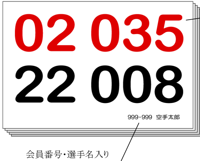
形・組手の2競技用

なお、この斡旋販売は、任意です。別途ゼッケン制作方法に従い各自でお作り頂くことを基本としています。